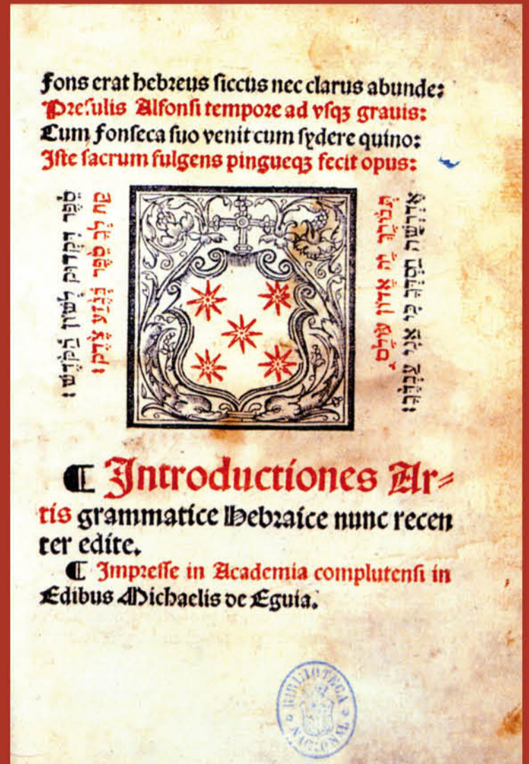
Alfonso de Zamora: Introductiones Artis grammaticae hebraice nunc recenter edite . Alcalá de Henares, Miguel de Eguía, 1 mayo 1526.