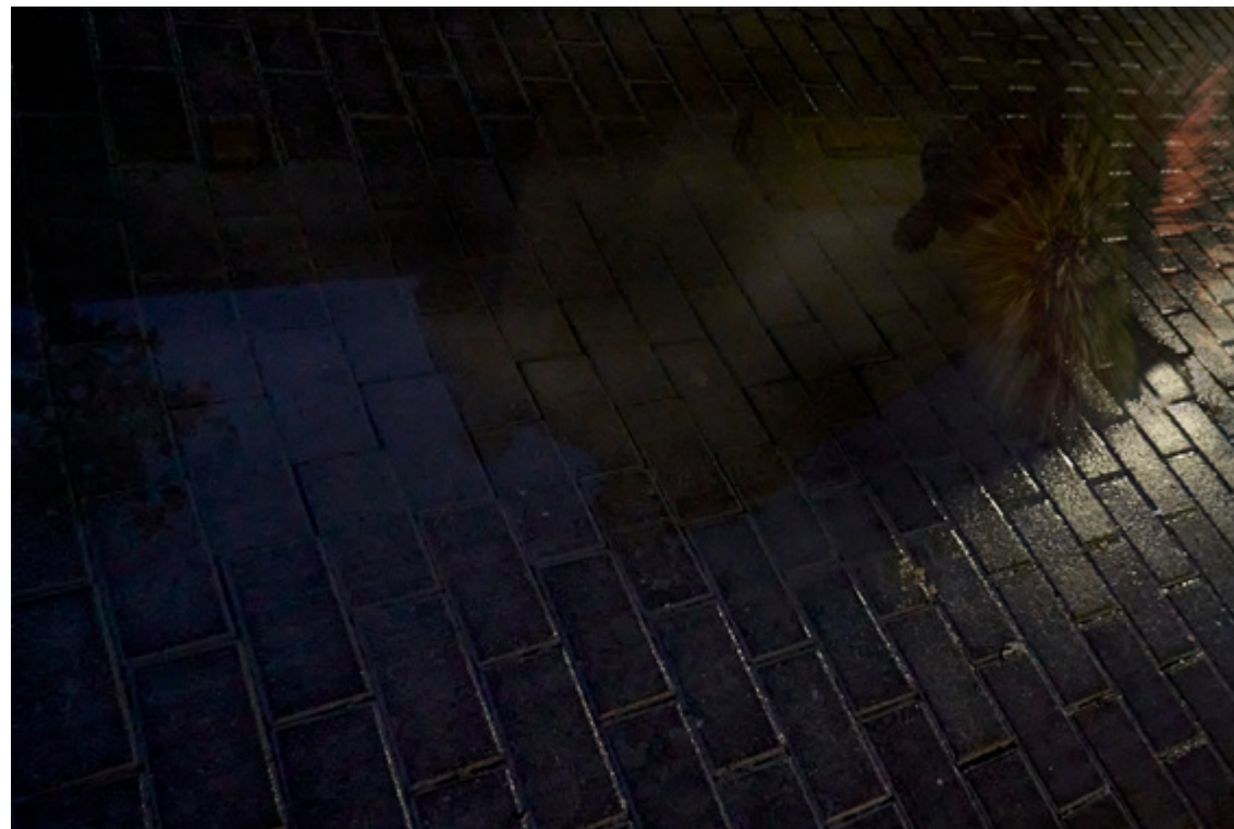
Fotografía de Lourdes Casas