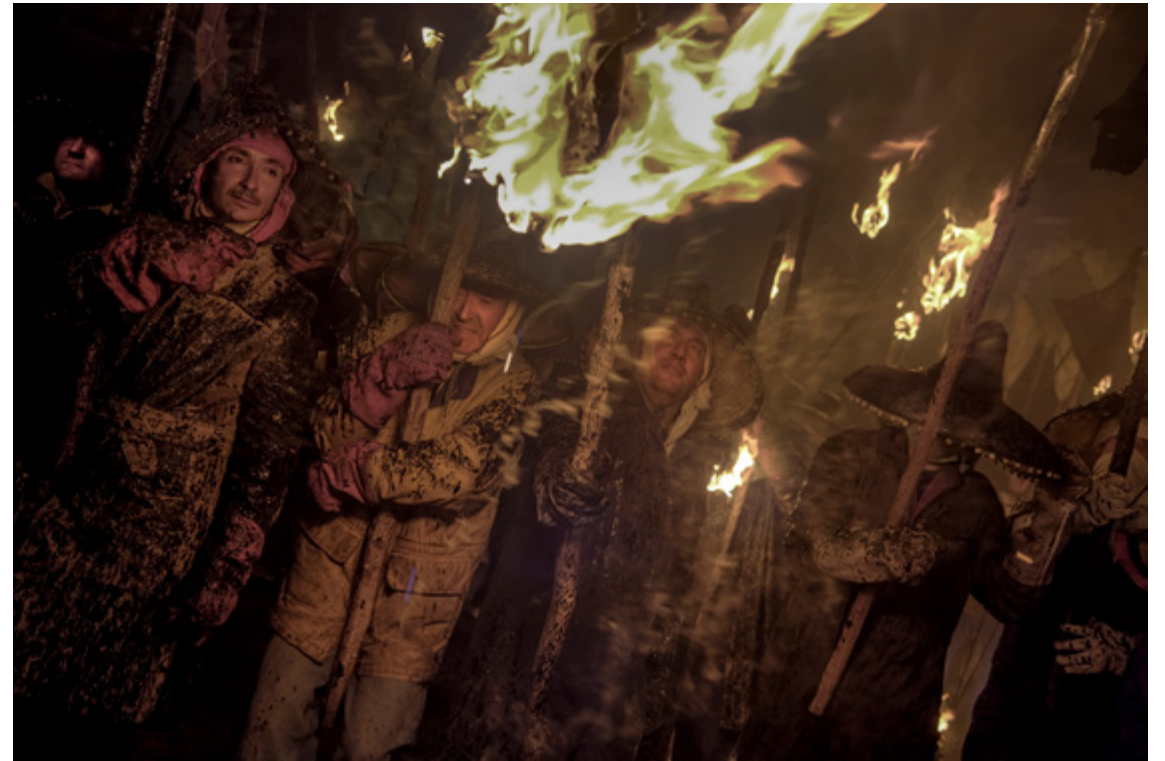
Fotografía de Andrés Marín