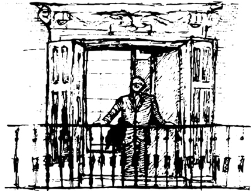
Ilustración por María Castillo