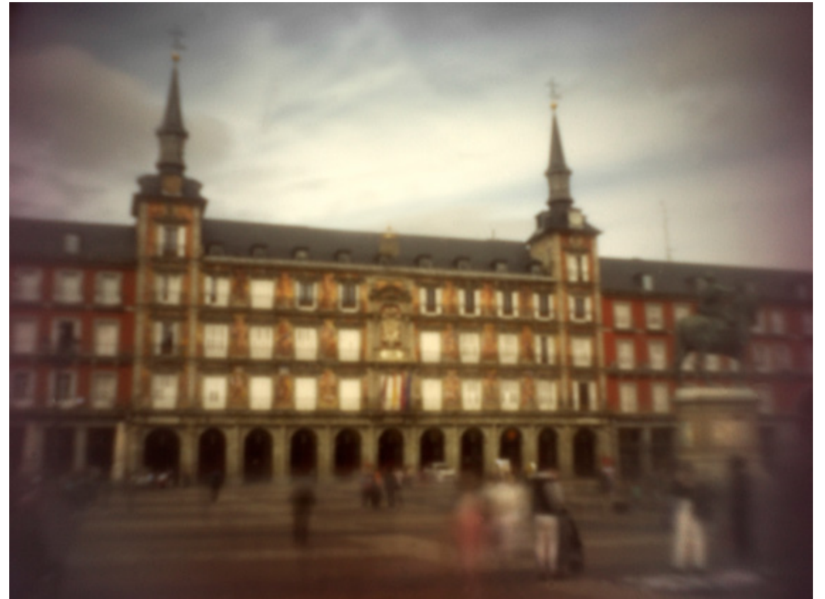
Fotografía de Rick Shepherd